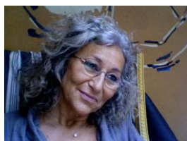
Sophie Chauveau