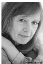
Marie Sellier