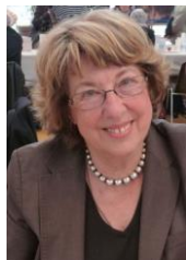
Pierrette Fleutiaux